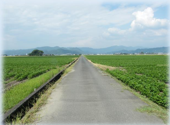
南高田から、高田方面の風景