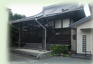
玉虫構造改善センター 玉虫公園