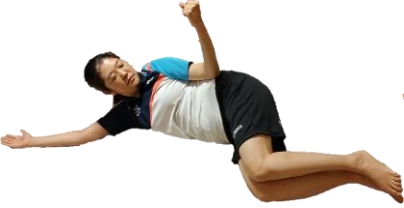
余裕があれば天井側の足を上げる