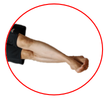
反対側も行います