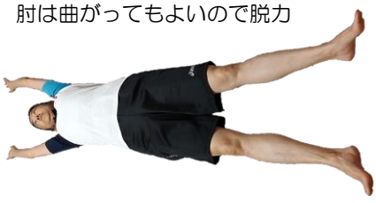
肘は曲がってもよいので脱力

② ①の姿勢のまま天井側の肘だけ90度に曲げ、曲げた肘を骨盤に近づけていきながら上体を真横に起こします。①⇔②を繰り返します。