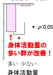
身体活動量とHVPG変化率の関係

HVPGの改善には、生活習慣の改善による減量が非常に重要です(左図)。また、食事制限をしなかったと考えられる体重減少率が低い群の中では、身体活動量が多い群のHVPGが改善していました(右図)。