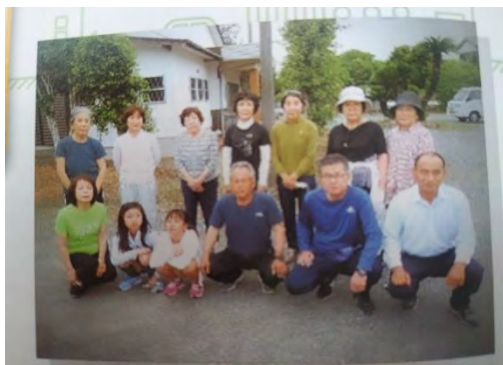
四三嶋区のラジオ体操の取組みが議会だより（うぐいす）で紹介されました。