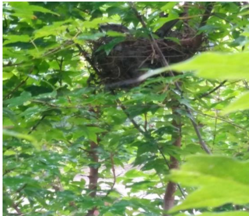
居間から見えるところにヒヨドリの巣