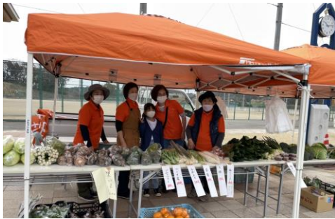
3/27 多目的運動公園でマルシェが開催