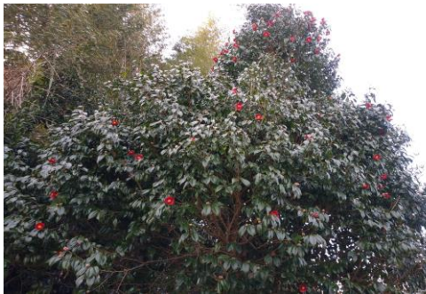
(今年の躑躅花が少ないようです)