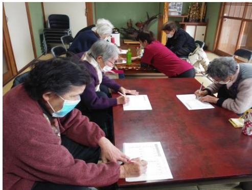
すこやかサロン風景 (脳トレ)