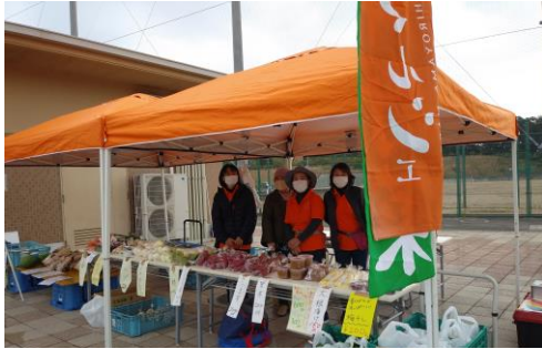
多目的運動公園でのマルシェの様子