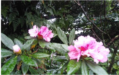
我が家のシャクナゲ狂い咲き 9/14 撮影