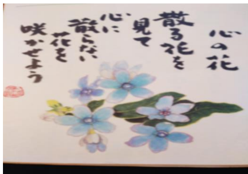
(心にしみる詩画集毎月掲載します)

コロナワクチン1期の予約状況は、9,000人中2,700人の予約が完了しています。2期の予約については、現在協議中で6月配布の広報に詳細は掲載されます。65歳以上の筑前町の高齢者は7月中には2期の1回目は全員接種できるよう調整中とのことです。心配しないでお待ち下さい。 (コールセンター情報)